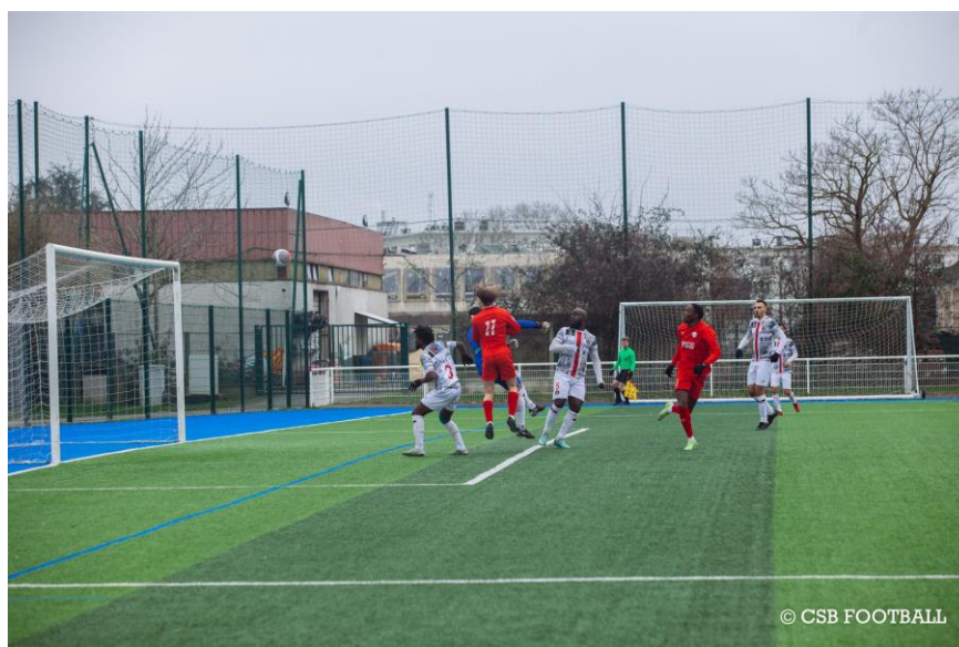
Des joueurs passés par nos Sections sportives scolaires évoluent régulièrement en National 3

Certains joueurs parviennent à s'épanouir au sein de la structure même du club en continuant leur progression pour atteindre le niveau senior, actuellement dans le relevé championnat National 3. Plusieurs joueurs formés au club et dans nos Sections font partie, en effet, du groupe de l'équipe première du club. Dans des proportions uniques à ce niveau pour un club amateur.