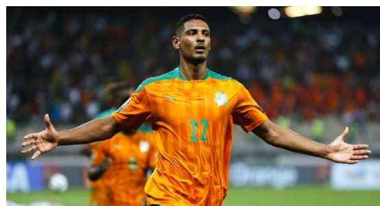
Sébastien Haller, international Ivoirien