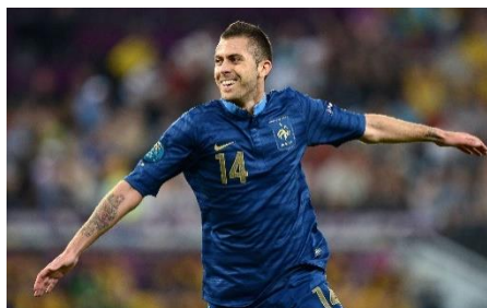
Jérémy Ménez, International Français